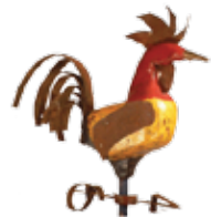
Festival de Sculptures d'Art Populaire de Saint-Ulric

Nous sommes à préparer l'édition 2018 du Festival qui se tiendra les 27, 28 et 29 juillet prochains.