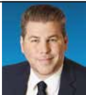
Pascal Bérubé Député de Matane-Matapédia

Une initiative de la Table en loisir de La Matanie.