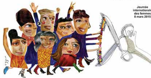
Journée internationale des femmes 8 mars 2015