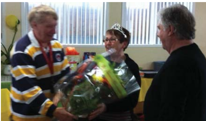
Notre Maman de l'année qui reçoit son prix.