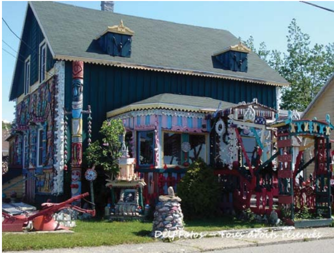
La maison de pain d'épices